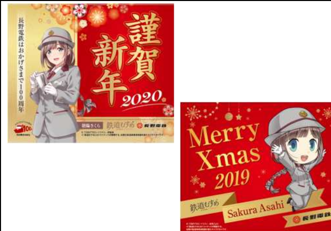
【朝陽さくら】ポストカードセット(2019冬)@300円