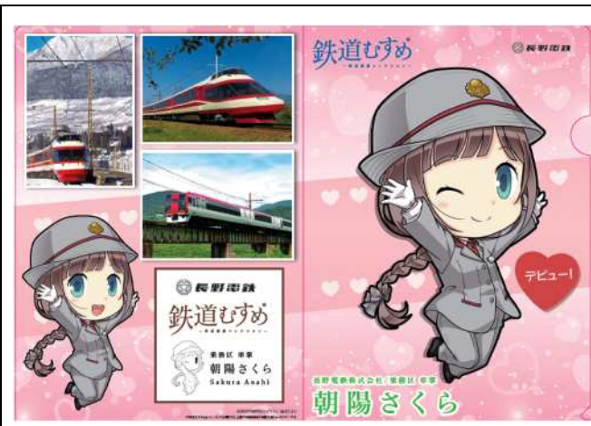
【朝陽さくら】クリアファイルB@300円