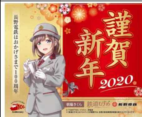
【朝陽さくら】マグネット(2020 謹賀新年)@800円