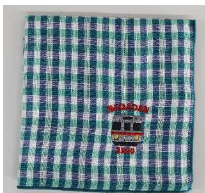
ながでんハンカチ(3500 系チェック)@600 円