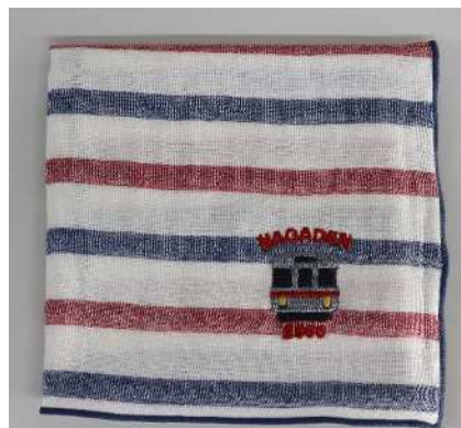
ながでんハンカチ(3500 系ボーダー)@600 円