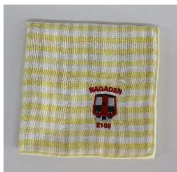
ながでんハンカチ(2100 系チェック)@600 円