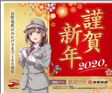
【朝陽さくら】アクリル-杓々 ® -(2020 謹賀新年)@600 円