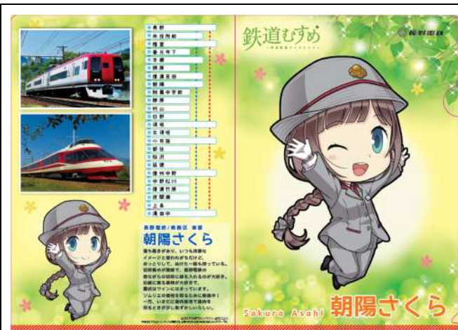
【朝陽さくら】キラキラクリアファイルD@450円