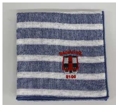
ながでんハンカチ(2100 系ボーダー)@600 円