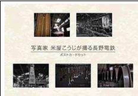
ポストカードセット 5 枚組 (電車) @600 円