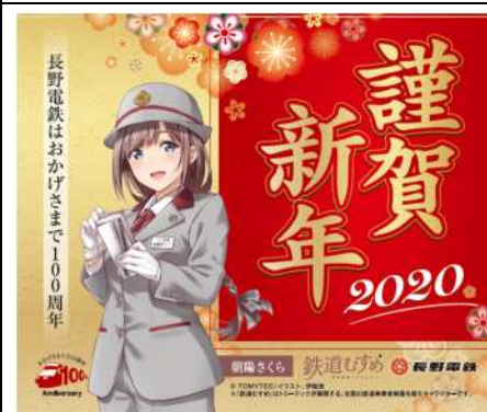
【朝陽さくら】ステッカー(2020 謹賀新年)@500円