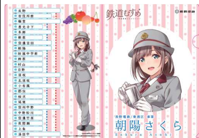
【朝陽さくら】クリアファイルC@300円