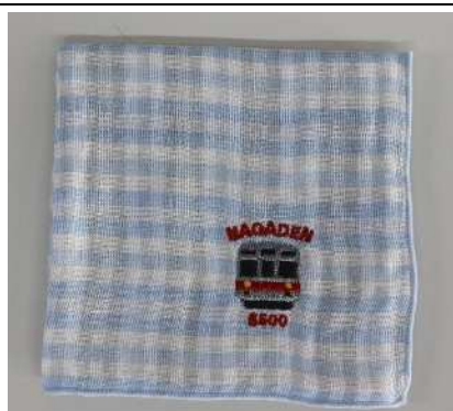
ながでんハンカチ(8500 系チェック)@600 円