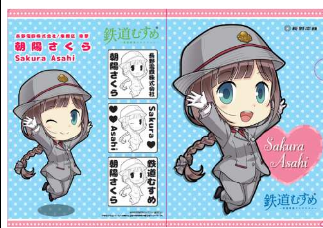
【朝陽さくら】クリアファイルD@300円