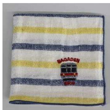
ながでんハンカチ(8500 系ボーダー)@600 円