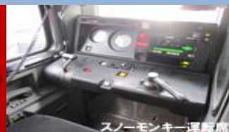
スノーモンキー運転台